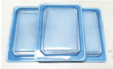
蛋白质止血贴片样品